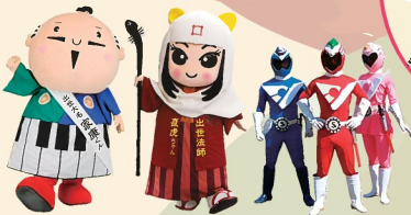
浜松市/ 出世大名家談くん 浜松市/ 出世法師貞虎ちゃん 下條村/ 地域戦隊カッサイガマン